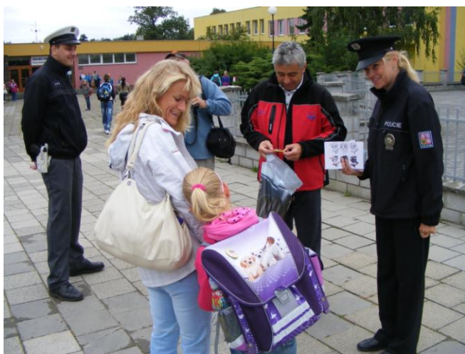
ZŠ Velká Dílážka

Všechny oslovené děti, dostali z rukou policistů a zástupce Besipu drobné dárky a preventivní materiály.